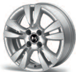
Obręcze aluminiowe 16" Ashera