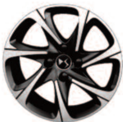
Obręcze aluminiowe 16" Aristée czarne diamentowane