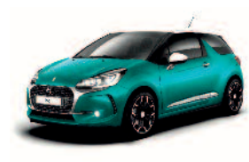
Vert Kingdom / Blanc Opale