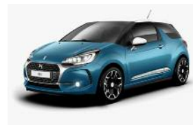
Bleu Encre / Blanc Opale