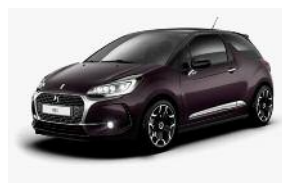
Whisper / Noir Onyx