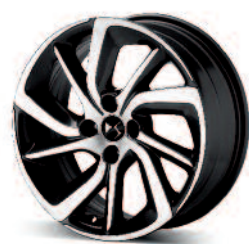
Obręcze aluminiowe 17" Aphrodite czarne diamentowane