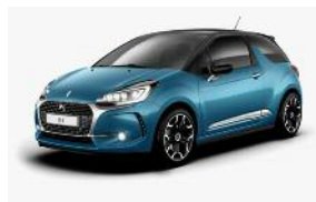
Bleu Encre / Noir Onyx