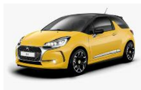
Jaune Pegase / Noir Onyx