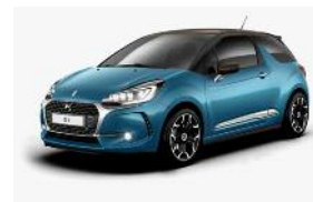
Bleu Encre / Brun Topaze