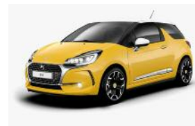
Jaune Pegase / Blanc Opale