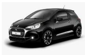
Noir Perla Nera