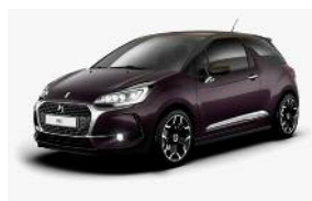
Whisper / Brun Topaze