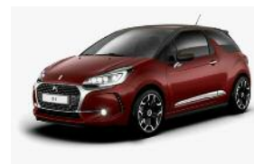
Rouge Rubi / Brun Topaze