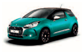
Vert Kingdom / Brun Topaze