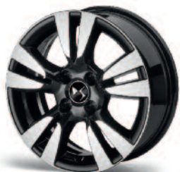
Obręcze aluminiowe 16" Ashera czarne diamentowane