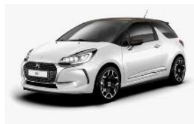
Blanc Perle Nacre / Brun Topaze