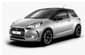
Gris Platinium / Noir Onyx