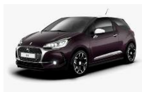
Whisper / Blanc Opale