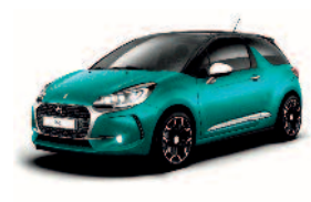
Vert Kingdom / Noir Onyx