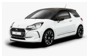
Blanc Banquise / Brun Topaze