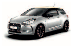
Gris Platinium / Creme Parthenon