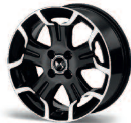
Obręcze aluminiowe 17" Bellone czarne