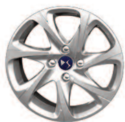
Obręcze aluminiowe 16" Aristée szare