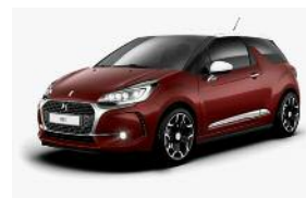
Rouge Rubi / Blanc Opale