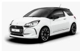
Blanc Banquise / Noir Onyx