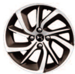
Obręcze aluminiowe 17" Aphrodite Brun Topaz diamentowane