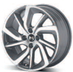
Obręcze aluminiowe 17" Aphrodite szare diamentowane