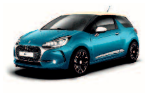
Bleu Encre / Parthenon