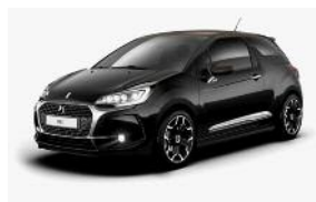
Noir Perla Nera / Brun Topaze