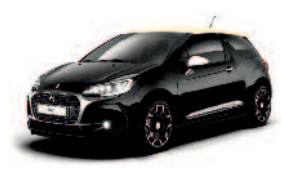
Noir Perla Nera / Creme Parthenon