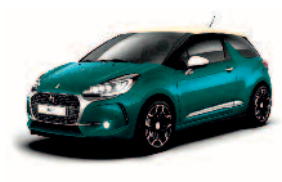
Vert Saphir / Creme Parthenon