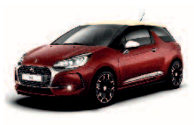
Rouge Rubi / Creme Parthenon