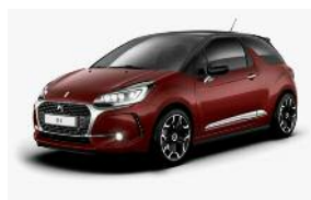
Rouge Rubi / Noir Onyx